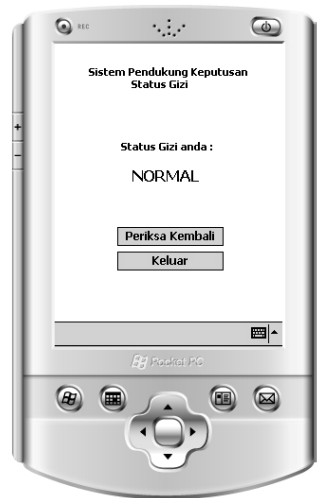
Gambar 4 Halaman hasil