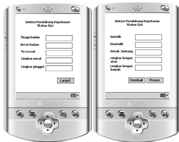
Gambar 3 Tampilan halaman konsultasi