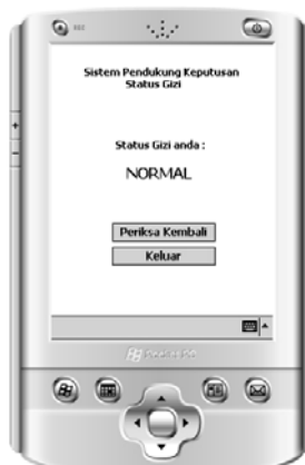
Gambar 6 Tampilan hasil status gizi dari pemilik data

Setelah dilakukan proses input data, maka proses selanjutnya adalah melakukan perhitungan terhadap data input berdasarkan basis pengetahuan yang ada pada sistem dengan menggunakan metode KNN dan akan menghasilkan status gizi dari pemilik data tersebut (Gambar 6)