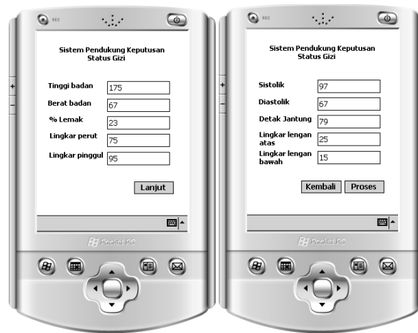
Gambar 5 Tampilan proses input data

Berikut ini merupakan tampilan sistem dengan diberi masukan data berdasarkan contoh kasus :